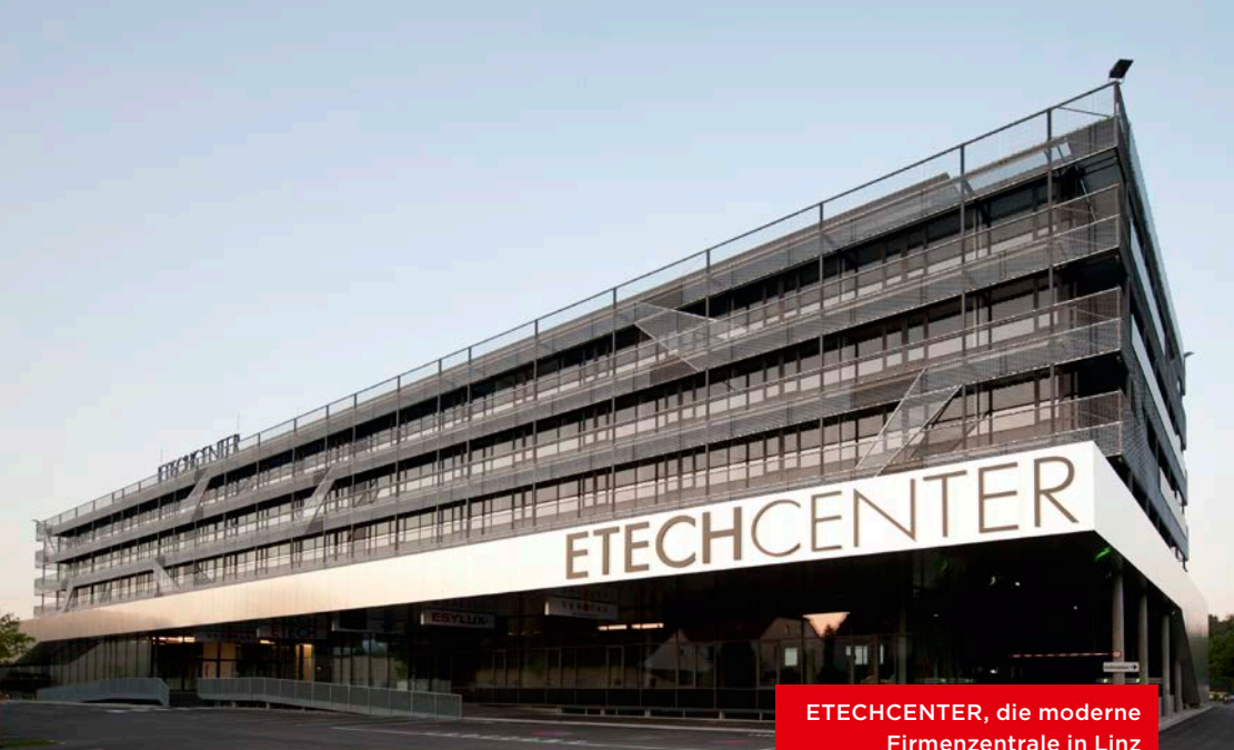
ETEHCENTER, die moderne Firmenzentrale in Linz